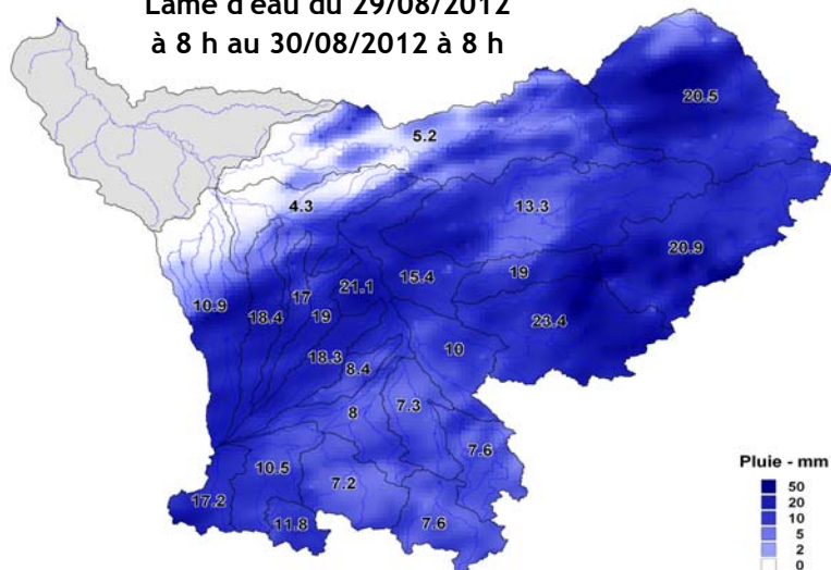
Lame d'eau du 29/08/2012 à 8 h au 30/08/2012 à 8 h

En cette fin du mois d'août, la situation reste tendue en Garonne pyrénéenne. Depuis un mois déjà, les débits se maintiennent sous le DOE à Portet malgré les réalimentations intensives de soutien d'étiage et le seuil d'alerte a été franchi durant 4 jours. Les pluies des derniers jours ont essentiellement touché les affluents de la Garonne à l'aval de Toulouse, apportant un répit en Garonne aval. Dans les Pyrénées, les précipitations ont entraîné de petites montées d'eau sur le Salat qui arriveront aujourd'hui à Portet. Ces apports d'eau sont toutefois insuffisants et le soutien d'étiage reste nécessaire pour éviter le franchissement du seuil d'alerte dans les jours à venir.