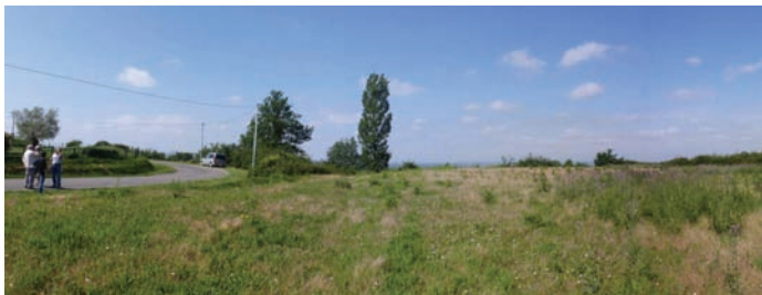
Le balcon de Beausoleil

La promenade en bord de terrasse sous une tonnelle de platanes taillés et les tables panoramiques associées