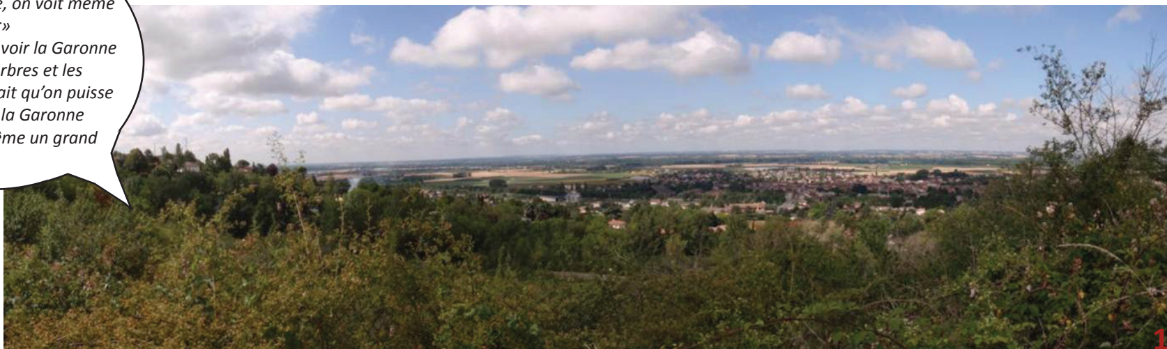
1/ Vue panoramique depuis le balcon de Beausoleil

«par temps clair on voit jusqu'à Toulouse, on voit même les avions décoller» «on aura du mal à voir la Garonne parce qu'il y a les arbres et les feuillages, il faudrait qu'on puisse la voir parce que la Garonne c'est quand même un grand fleuve»