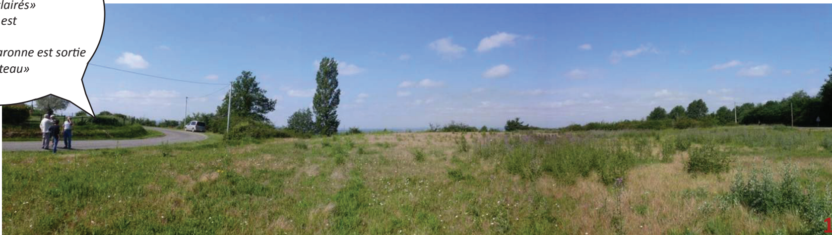
1/ Le balcon de Beausoleil

«le panneau a été enlevé, c'est dommage, c'est un point de vue magnifique, l'été on voit tous les villages éclairés» «le soir, la lumière est impressionnante» «en 52 quand Garonne est sortie on allait au coteau»