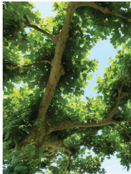
Une pergola en dentelle de platanes... Des aires de stationnement intégrées ...