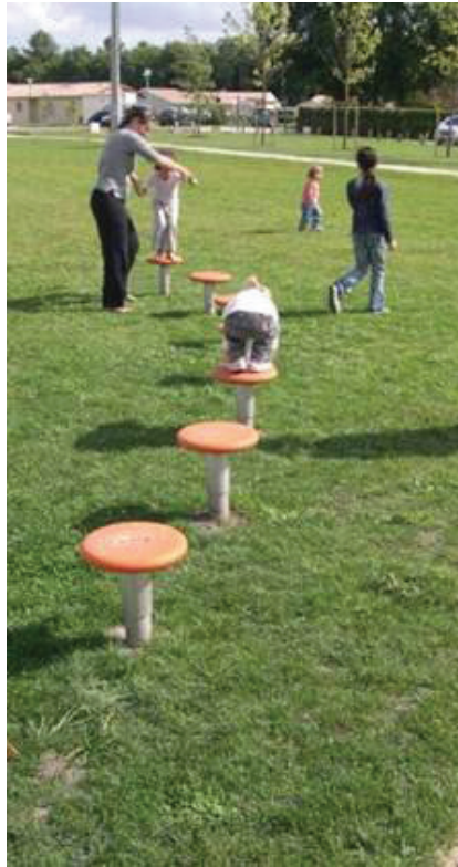
Des jeux d'enfants originaux, ludiques et simples ...